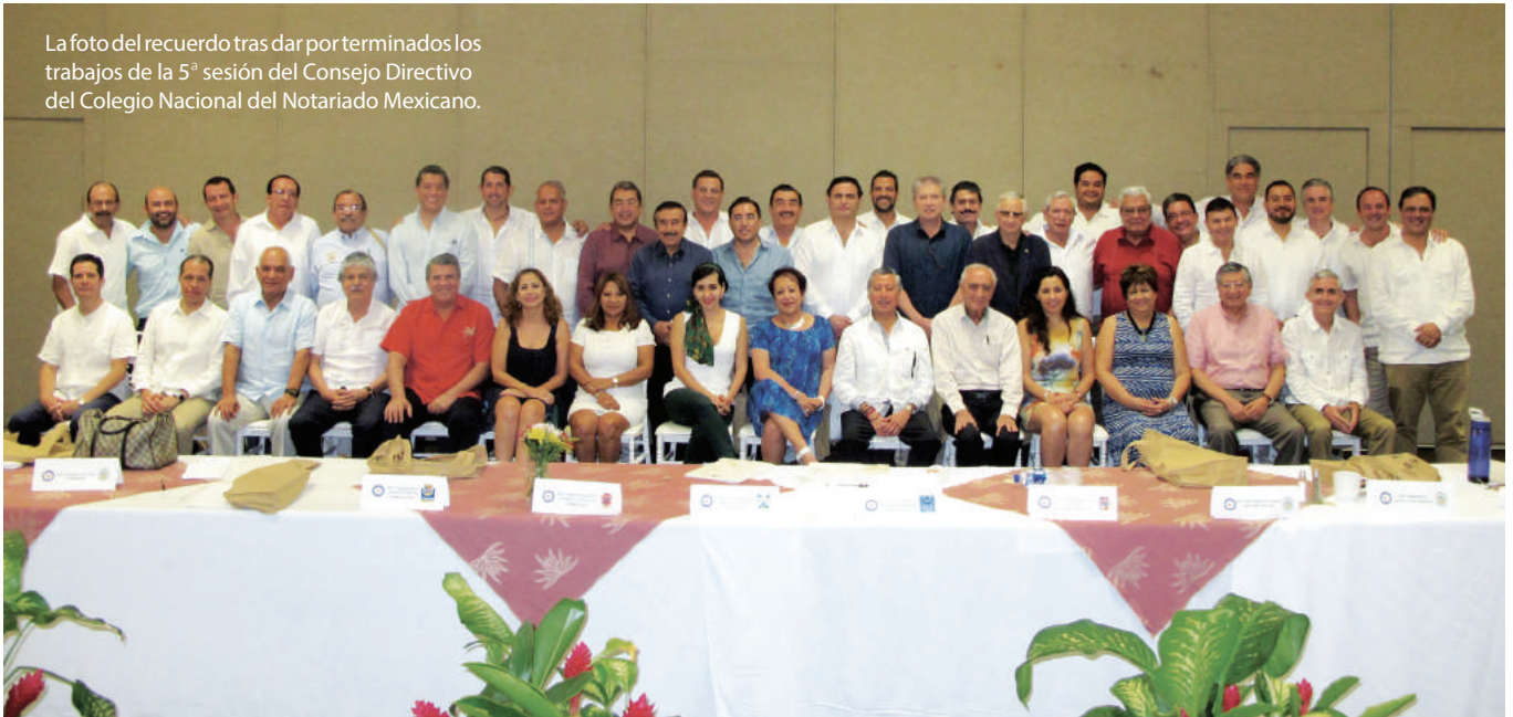
La foto del recuerdo tras dar por terminados los trabajos de la 5ª sesión del Consejo Directivo del Colegio Nacional del Notariado Mexicano.