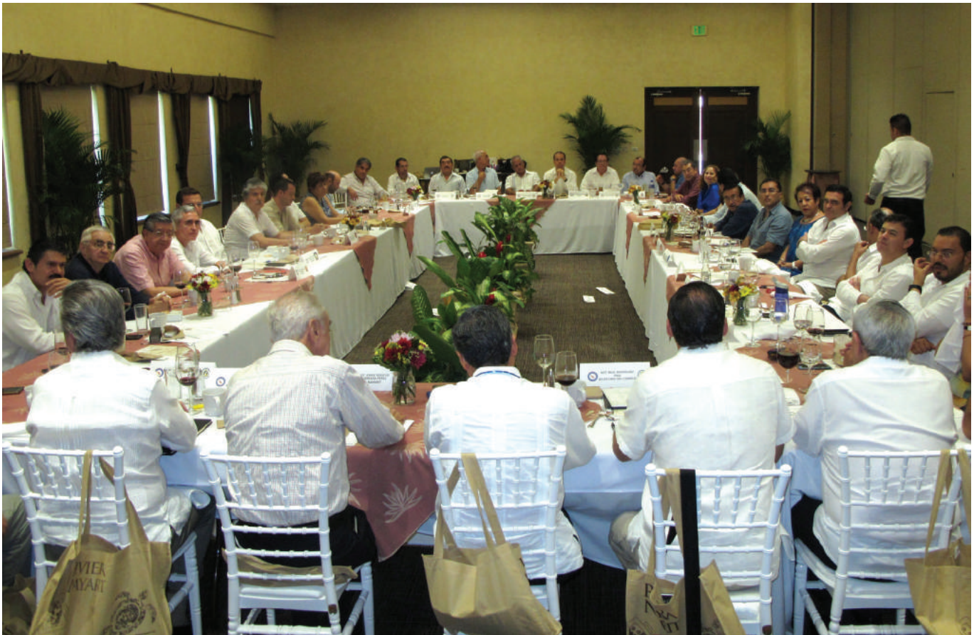
El viernes 1 de septiembre se celebró en Nuevo Vallarta la 5ª sesión del Consejo Directivo del Colegio Nacional del Notariado Mexicano.