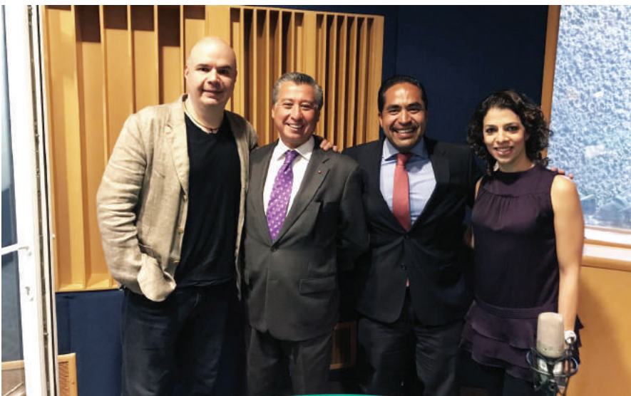
El presidente del CNNM, José Antonio Manzanero Escutia y el titular de la Unidad General de Asuntos Jurídicos de la Secretaría de Gobernación, David Arellano Cuan, en la grabación del programa radiofónico “La hora nacional”.

Durante septiembre, el CNNM realizó importantes esfuerzos de promoción de la campaña a nivel nacional, este año se distribuyeron 2 boletines de prensa, un folleto electrónico, 4 infografías y se llevaron a cabo 16 entrevistas que generaron más de 414 notas en prensa y medios electrónicos.