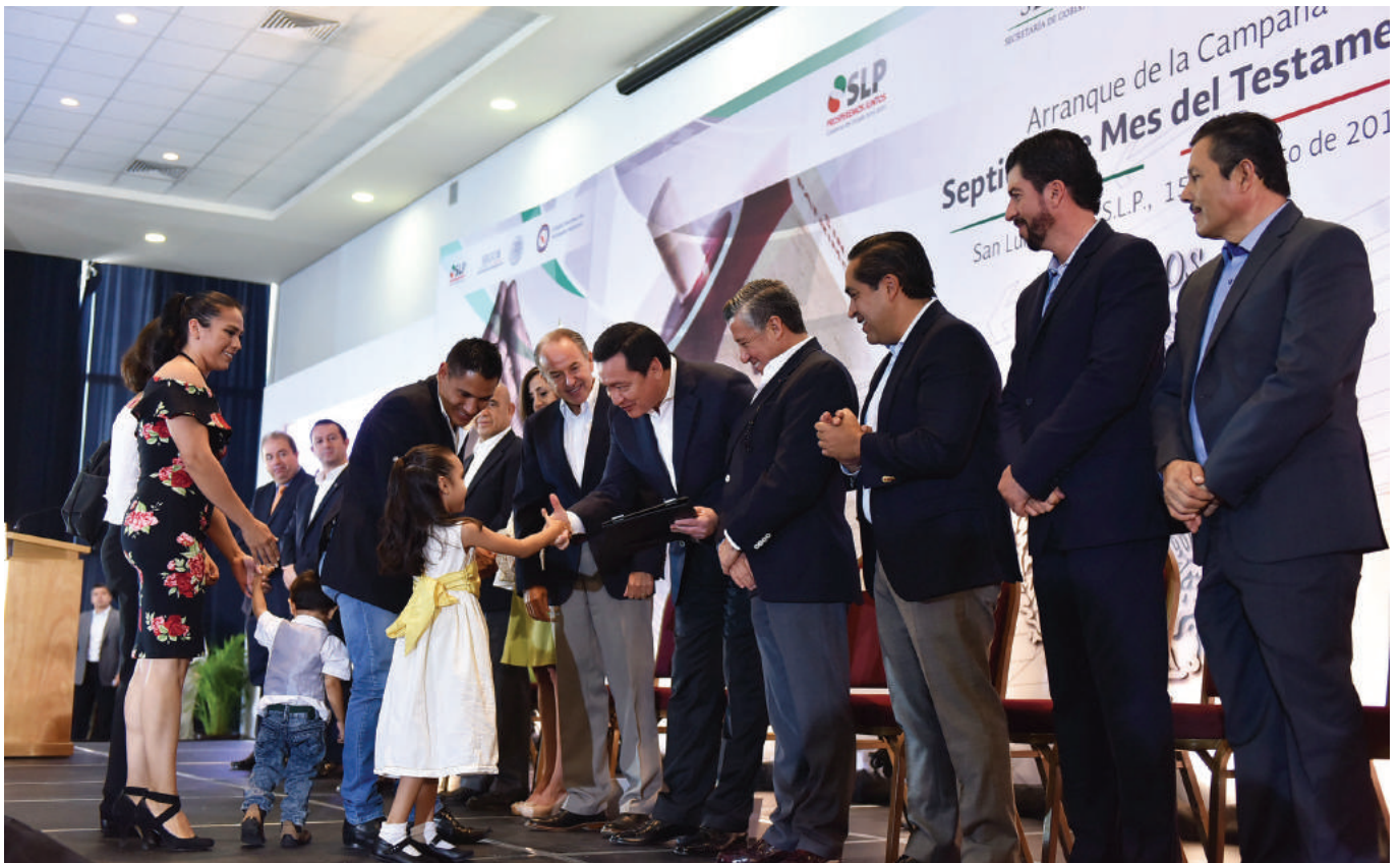
Miguel Ángel Osorio Chong entrega testamentos a familias potosinas.