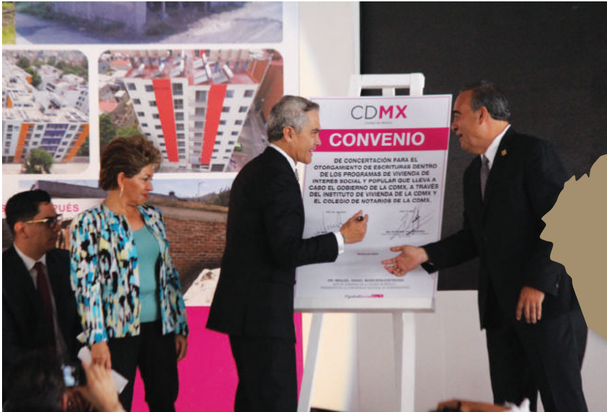
Miguel Ángel Mancera, jefe de Gobierno capitalino, firma como testigo de honor el convenio de colaboración celebrado por el Colegio de Notarios del Distrito Federal y el instituto de la Vivienda de la Ciudad de México (INVI).