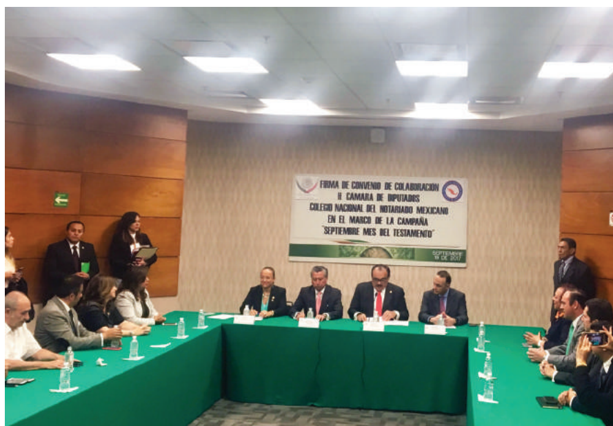
El CNNM firmó un convenio de colaboración con la Cámara de Diputados para instalar cada año un módulo de atención en septiembre con el fin de brindar asesoría testamentaria y notarial.