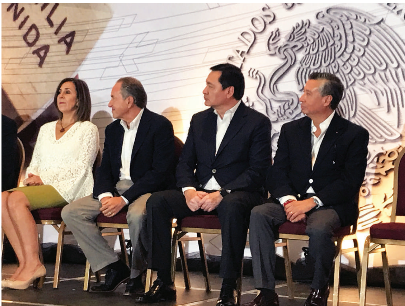
El secretario de Gobernación, Miguel Ángel Osorio Chong, en el evento de arranque de la campaña "Septiembre, Mes del Testamento" en San Luis Potosí.

iniciativa, indicó, los notarios amplían sus horarios de atención y ofrecen descuentos de hasta 50 por ciento.