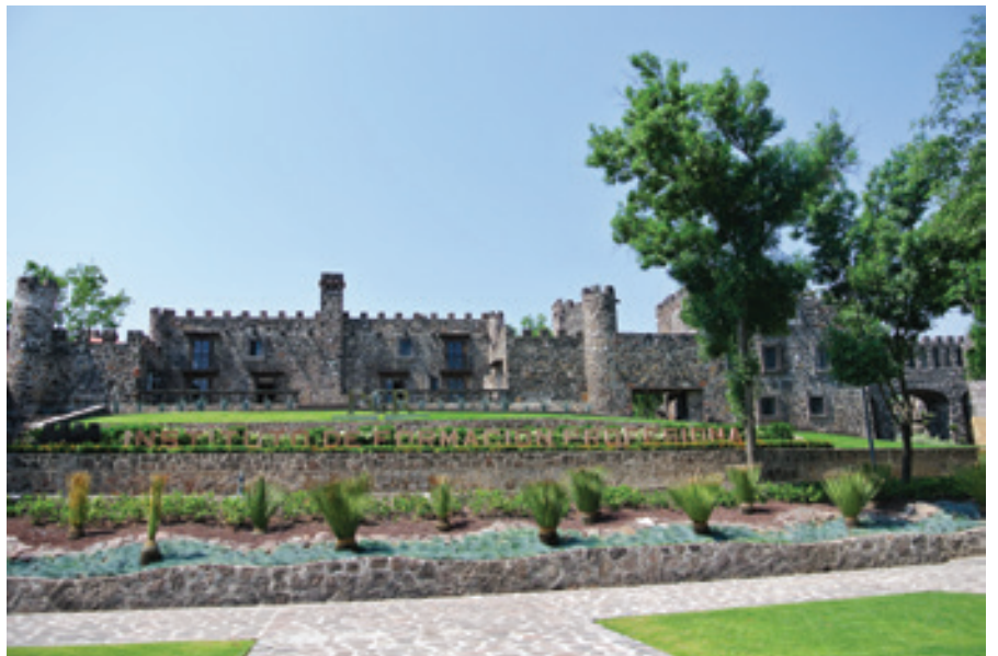
Instalaciones del Instituto de Formación Ministerial, Policial y Pericial de la PGR (IFMPP), también conocido como La Muralla, ubicado en el municipio de San Juan del Río, Querétaro.