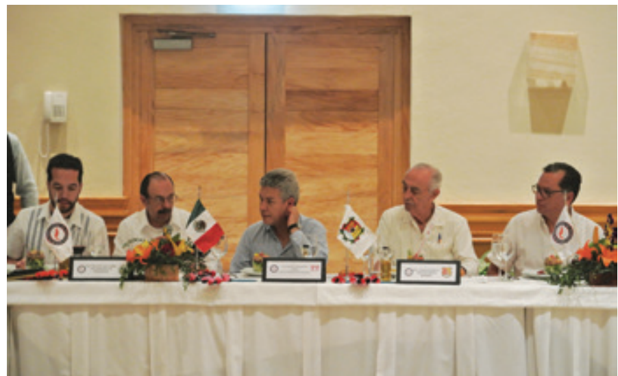
David Penchyna, Director General del Instituto del Fondo Nacional de Vivienda de los Trabajadores (Infonavit), escuchó las inquietudes de los notarios asistentes en temas relacionados al Instituto.