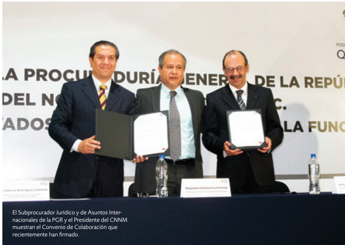
El Subprocurador Jurídico y de Asuntos Internacionales de la PGR y el Presidente del CNNM muestran el Convenio de Colaboración que recientemente han firmado.