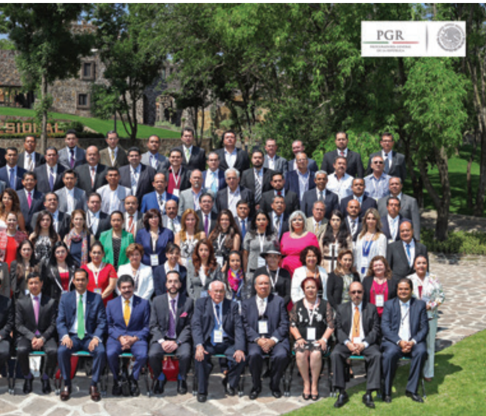
Foto panorámica con los notarios participantes en el 1º Seminario sobre los delitos derivados de la Ley Antilavado y la Función Notarial.