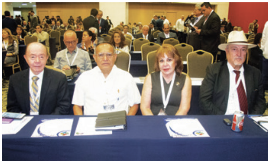
Asistentes a la Jornada Regional del Notariado 2016 en León, Guanajuato.