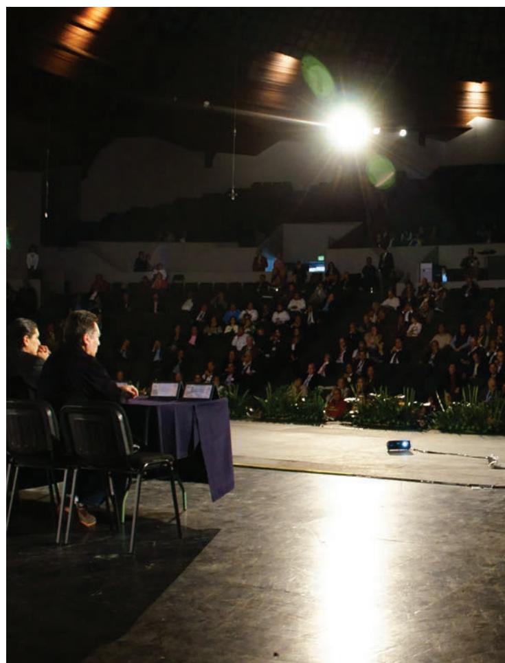
▲ La actividad más importante para el CNNM

Además de las jornadas nacionales, del seminario de actualización fiscal y del curso a nivel nacional, tanto presencial como por videoconferencias, se coordinaron y llevaron a cabo, multitud de actividades en las que se incluyen cursos, diplomados, talleres y conferencias a nivel regional y estatal, incluyendo las relativas a las disposiciones contra el lavado de dinero y logramos poner en marcha uno de los objetivos que se había fijado este Consejo, que es el de los talleres de redacción notarial, ojalá el próximo Secretario Académico y todo el Consejo lo vean con simpatía, pues al darle ▶