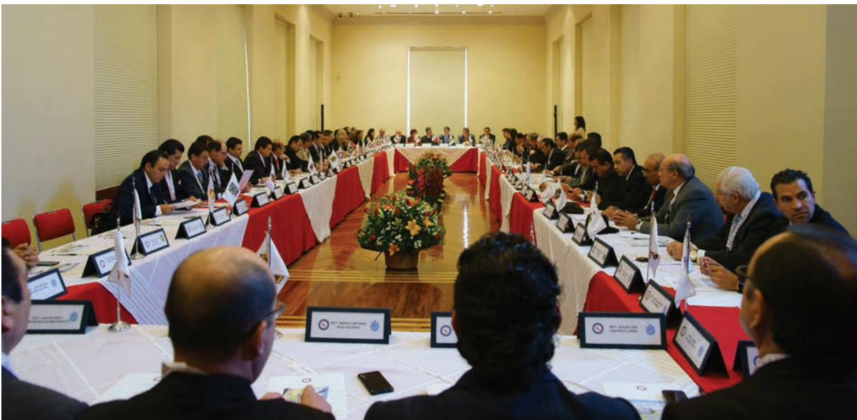
▲ La última sesión de trabajo del Consejo Directivo 2013-2014.