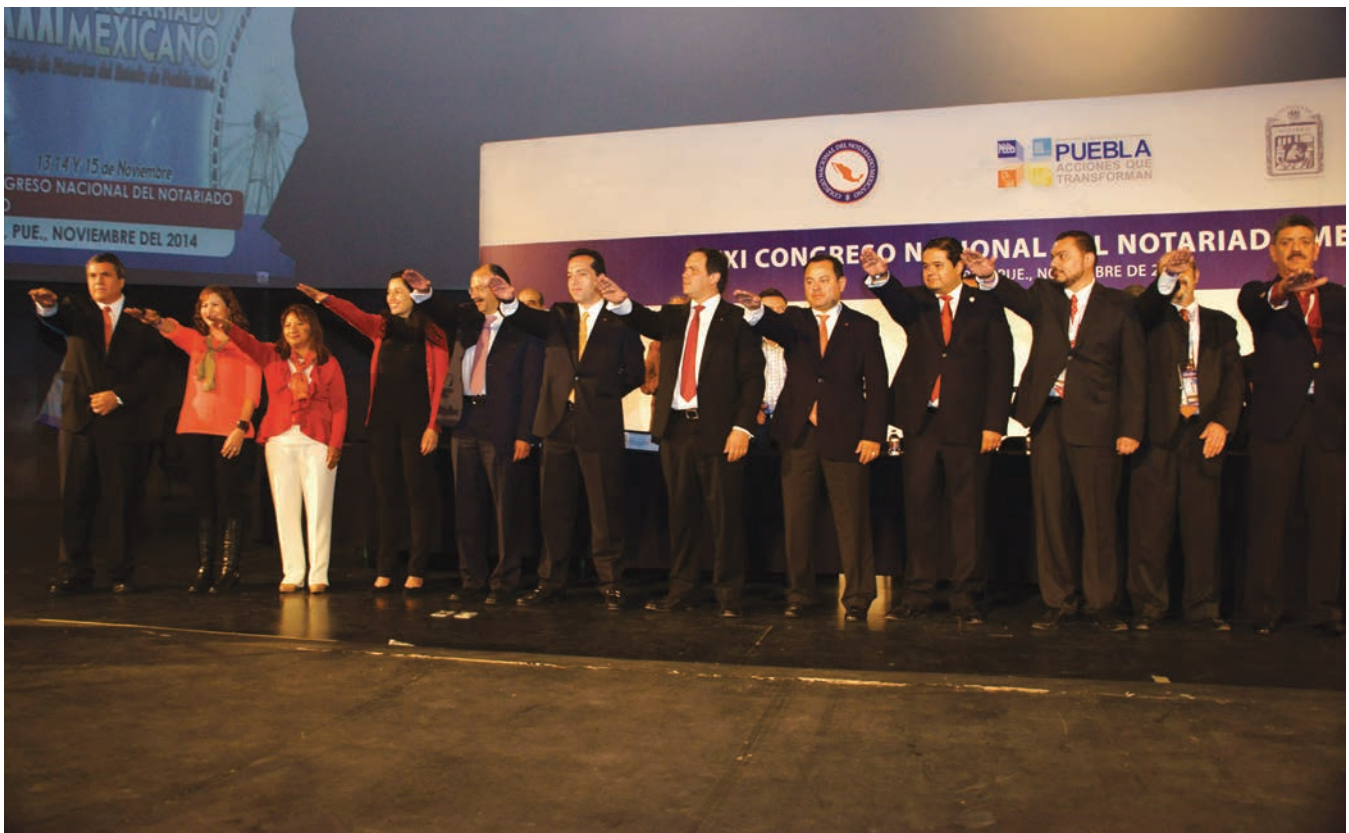
▲ El Consejo Directivo electo rinde protesta.