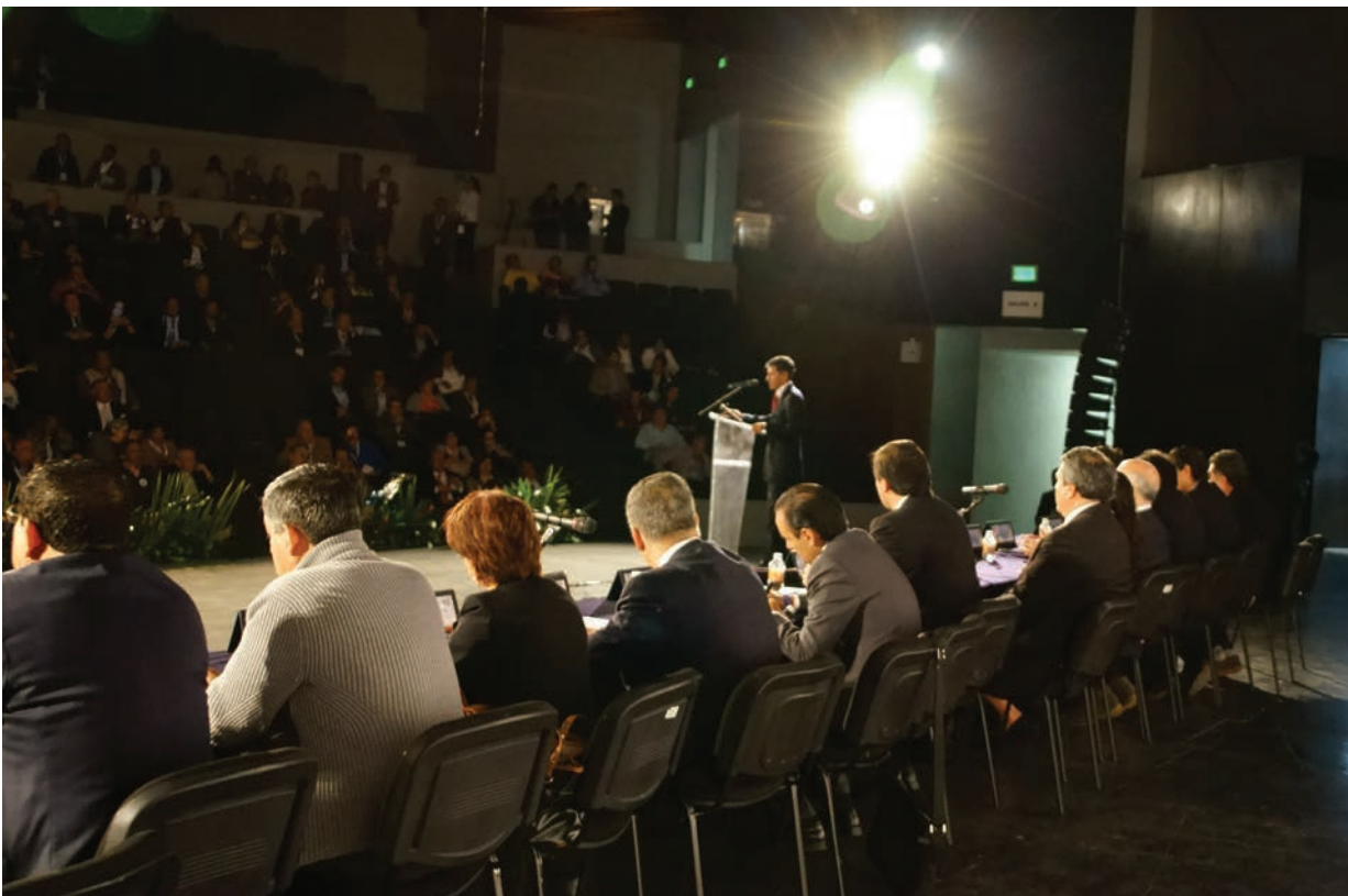
▲ Finanzas sanas y cambio en el objeto social.

Justamente, con esa visión de cohesión y de presencia del notariado en la sociedad, es que el año pasado se puso a consideración de la asamblea, la reforma estatutaria, en la que uno de los aspectos más importantes consistía en el cambio de razón social de esta institución para pasar a ser de una Asociación del Notariado al Colegio Nacional del Notariado Mexicano, fue este uno de los objetivos que se fijó este Consejo Directivo, al principio del bienio, objetivo ya concretado. ▶