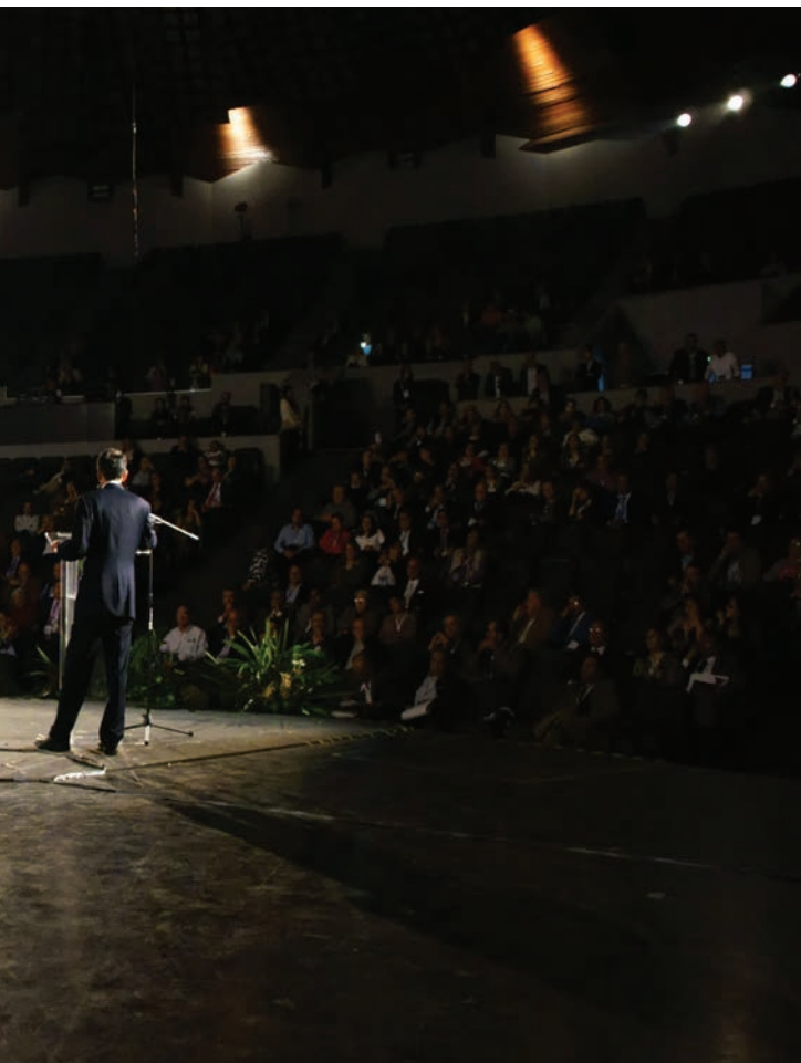
es la capacitación y actualización notarial.