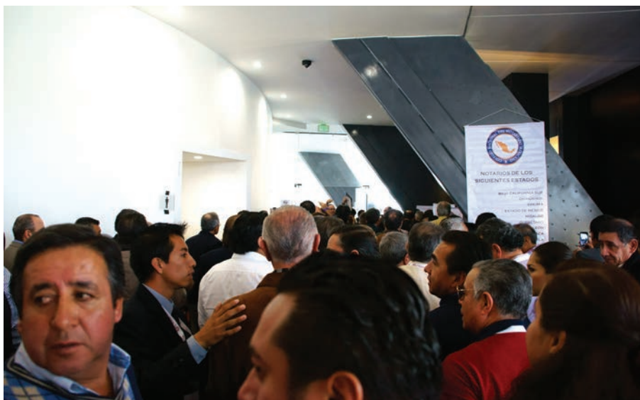
▲ Los notarios de todo el país expresando su voluntad mediante el voto.

En torno al programa de trabajo propuesto, señaló que su contenido era del conocimiento de todos los notarios. Sin embargo, como esquema de trabajo, para su realización requiere de la participación de todos los notarios de la República Mexicana. En la Institución notarial, desarrollar proyectos, cumplir objetivos, trasciende la participación y voluntad personal, aún las de los miembros de un Consejo Directivo. Por ese motivo, invitó a la audiencia a recuperar la