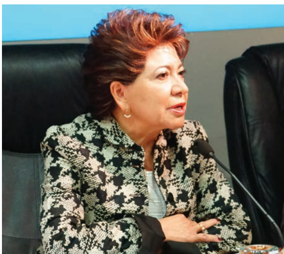
▲ Se organizaron tres jornadas, un congreso y dos seminarios de actualización fiscal, además de las dos versiones del Curso de Actualización.