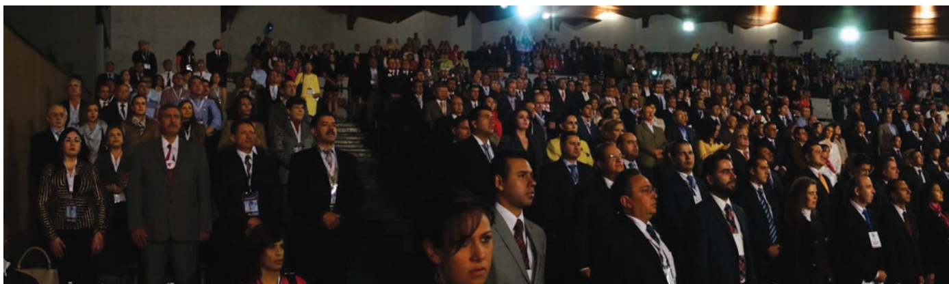
▲ El Notariado Mexicano durante la ceremonia oficial de apertura.

el ámbito de la certidumbre y seguridad jurídica esencial para las actividades sociales y productivas de México.