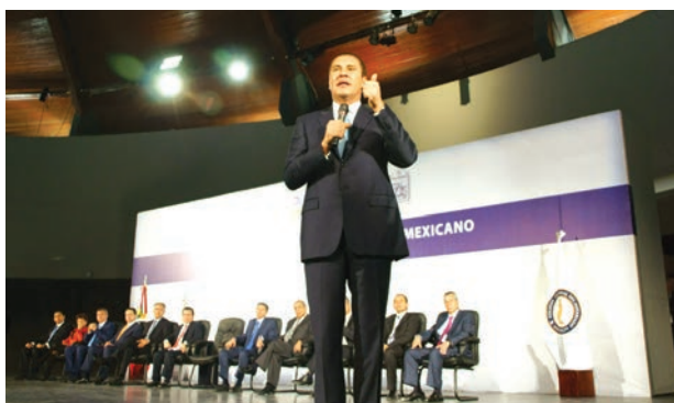
▲ El gobernador poblano, licenciado Rafael Moreno Valle da su mensaje al Notariado.

Durante el desarrollo del encuentro notarial, añadió, se tratarán temas como los de las reformas fiscal, financiera y los nuevos instrumentos de prevención contra el lavado de dinero. Van ustedes a tratar, dijo a los asistentes, materias como el uso del idioma en los instrumentos notariales, lo cual es trascendental desde el punto de vista de los derechos fundamentales. La referencia del consejero jurídico, fue al contenido del Artículo 2 de la Constitución Política de los ▶