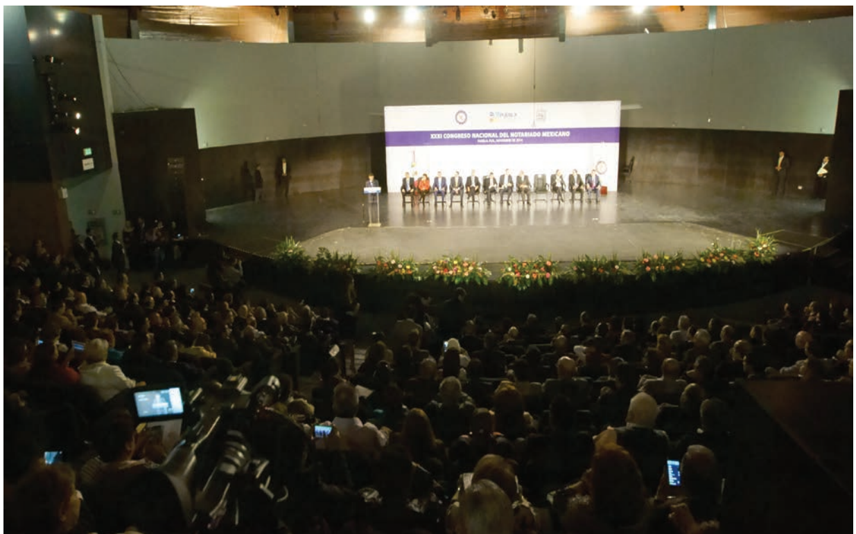
▲ Los más de mil 200 notarios asistentes al Congreso presencian la apertura oficial.

Terminó expresando que tenía conocimiento sobre encuentro notarial con el titular de la Unidad de Investigación sobre Lavado de Dinero de la Secretaría de Hacienda y Crédito Público ( sic ), y que con anterioridad el Colegio, a través del Consejo Directivo, ya lo había hecho durante el proceso para hacer claro y expedito el contenido de la mencionada normatividad. Convino en que a veces resulta difícil apearse a cierta normatividad, sobre todo si es compleja y debe reflejarse en algunos instrumentos notariales. Pero su cumplimiento es una contribución central en uno de los ejes del combate a la delincuencia y consiste en afectar sus estructuras financieras. Los notarios son partícipes fundamentales en dicha estrategia global, pues con la información que generan y comparten con la autoridad hacendaria, aportan con avances importantes en la prevención de ese tipo de actividades ilícitas. ▲