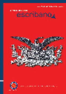
Imagen usada en el papel sellado de los protocolos notariales de mediados del siglo XIX.