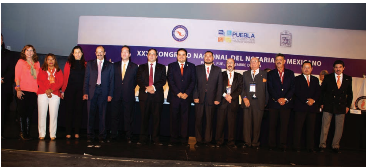
▲ El Consejo Directivo que representará al Notariado Mexicano durante el bienio 2015-2016.

Prosiguió el presidente electo señalando que el proceso democrático había concluido y que el mismo representaba un ejemplo de un simple ejercicio democrático de cualquier institución sólida. En ese marco felicitó al representante de la otra planilla participante, pues se había cumplido el pacto adquirido de competir cumpliendo con el deber ético. Fue un compromiso, abundó, de ▶